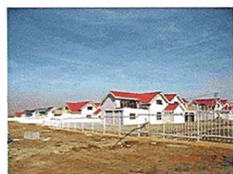
"Жаргалант эко" хувийн орон сууцны хороолол

Н эгдсэн үндэстний байгууллагын хөгжлийн хөтөлбөр, Зам, тээвэр, барилга, хот байгуулалтын яам хамтран хэрэгжүүлж байгаа Барилгын эрчим хүч хэмнэлтийн МОН/09/301 төслөөс иргэдийг өнөөгийн барилгын салбарт мөрдөгдөж буй норм стандартын шаардлагад нийцсэн сууцтай болоход дэмжлэг үзүүлэх