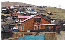
Гэр хорооллын түгээмэл төрх.

Гэр хорооллын сууцны бүтцийг аваад үзэхэд Улаанбаатар хотод 2004 онд 56,2 мянган гэр, 61,4 (52 хувь) мянган жижиг хувийн орон сууц байсан бол 2011 онд 81,6 мянган гэр 100,3 (55 хувь) мянган жижиг хувийн орон сууцтай болсон байжээ. Эндээс үзэхэд жилд дунджаар 5000 хувийн сууц Улаанбаатар хотод баригдаж байгаагийн дийлэнхи нь гэр хороололд байна. Хүн амын амжиргааны түвшинтэй уялдаад энэ тоо сүүлийн жилүүдэд улам ч хурдацтай нэмэгдэж байна.